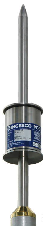
Ref. 102010 INGESCO PDC AIR60

Pararrayos con dispositivo de cebado electrónico, normalizado según norma UNE 21.186:2011 NF C 17-102:2011 NP4426:2013